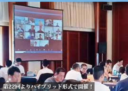
第22回よりハイブリッド形式で開催！