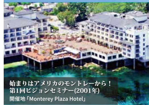
始まりはアメリカのモンテレーから！ 第1回ビジョンセミナー(2001年) 開催地「Monterey Plaza Hotel」